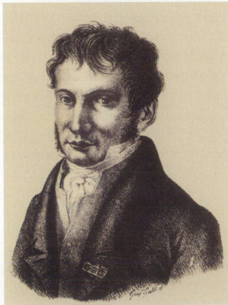
Ἀνδρέας Μουστοξύδης (1785-1860).