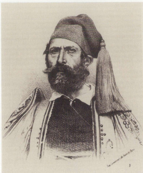
Ζήσης Σωτηρίου (†1880).

Ἄν ὅλοι ἐμιμούμεθα τὸν Ζήσιν Σωτηρίου δὲν θᾶχε χρεῖαν ἡ Ἑλλάς Εὐρώπης συνεδρίου 10 Ἰουλίου 1880 3