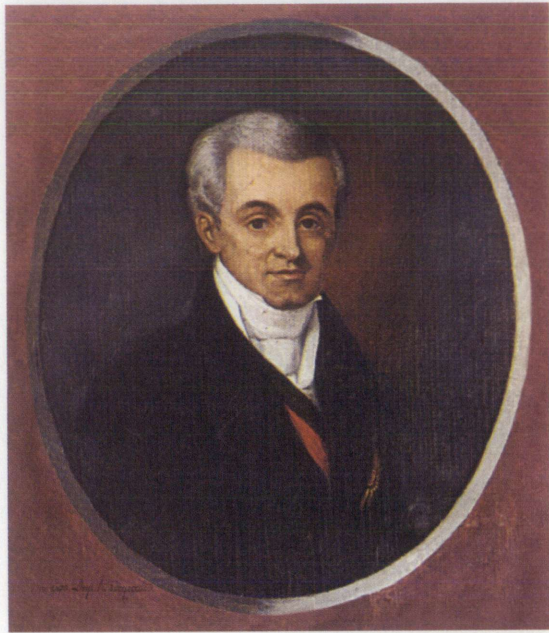
Ἰωάννης Ἀ. Καποδίστριας (1776-1831).