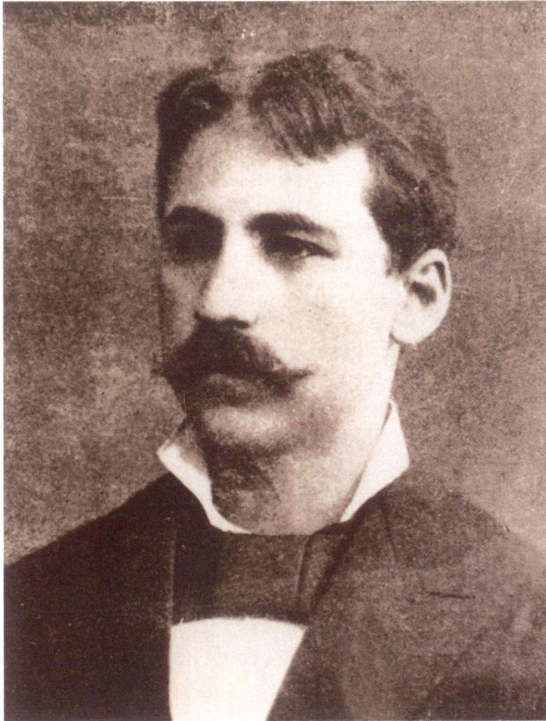
Χρήστος Τσοούντας (1857-1934), φοιτητής στη Γερμανία.