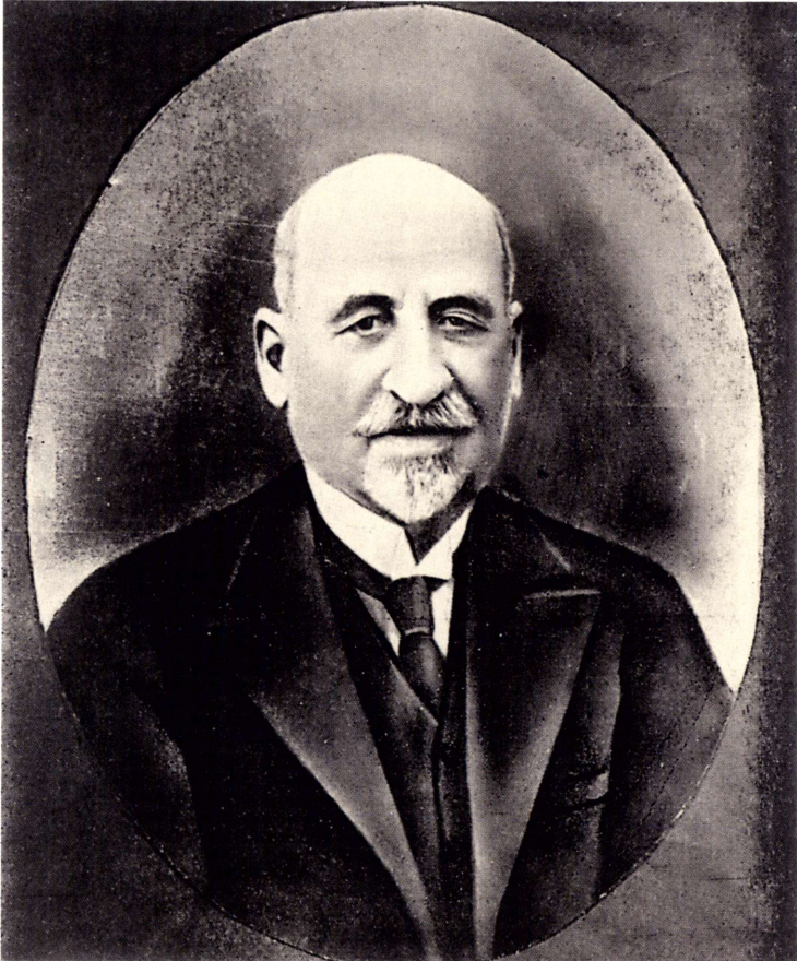
Ό Χρήστος Τσουντας περί τὸ 1930.