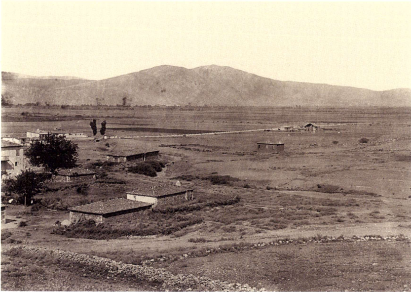
Ἡ πεδιάδα τῆς Χαϊρώνειας (1910). Στὸ βάθος δεξιὰ ὁ λέων κατὰ τὴ διάρκεια τῆς ἀναστήλωσής του.

οἴσθηκε τελευταῖα νὰ γίνῃ ἰδιωτικὸ ἐργοστάσιο ἠλεκτρισμοῦ, παρὰ τὶς ἀντιδράσεις. Ἐὰν τὸ ἐργοστάσιο θὰ βλάψῃ τὴν ἰδέα τῆς ἐλευθερίας, ἢ τοὺς κοιμισμένους ἐκεῖ, ἀπὸ τὸ 338 π.Χ. ἱερολοχίτες, δὲν τολμῶ νὰ προβλέψω. Γνωρίζω ὅμως καλὰ ὅτι οἱ κάτοικοι τῆς Ἑλλάδος μπορεῖ νὰ μὴν ἀγαποῦν τὰ ἀρχαῖα καὶ τοὺς ἱστορικοὺς τόπους, γὰρ τὸν ἐμποδίζουν σὰ οἰκοδομικὰ καὶ ἐπιχειρηματικὰ ἔργα τους, πιστεύουν ὅμως ὅτι καλὸν δέ γε κληρονομεῖν πατρῶας εὐδοξίας (εἶναι ὅμως λαμπρὸ νὰ κληρονομοῦν τὴ δόξα τοῦ πατέρα) 2 . Ἡ φράση ἀφορᾷ τὰ παιδιὰ τῶν σκοιτωμένων Ἀθηναίων σὴ μάχῃ τῆς Χαϊρωνείας, ἔχει ὅμως ἐφαρμογὴ σὲ ὅλους μας, ἀπὸ τὸ 1821 ἕως σήμερα.