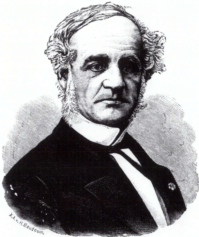
Ὁ Ἀλέξανδρος Ρίζος Ραγκαβῆς (1809-1892), πρῶτος γραμματέας τῆς Ἀ. Ἐτ. (1837-1851), ἓνας ἀπὸ τοὺς πρῶτους Ἑλληνες ἀρχαιολόγους.