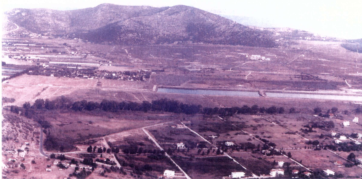
Ἡ πεδιάδα τοῦ Μαραθῶνα κατὰ τὴ διάρκεια κατασκευῆς τοῦ λεμβοδρομίου.

Εἶχε διοριστεῖ, ὡς ἔκτακτη ἐπιστημονικὴ βοηθός, τὸ 1969 καὶ μὲ τὴν ιδιότητα αὐτὴ ὑπηρέτησε μέχρι τῆς μονιμοποιήσεώς της, τὸ 1983. Τὴν περίοδο 1976-1983 ἦταν τοποθετημένη στὴν ὑπὸ τὴ διεύθυνσή μου Ἐφορεία τῶν Ἀρχαιοτήτων