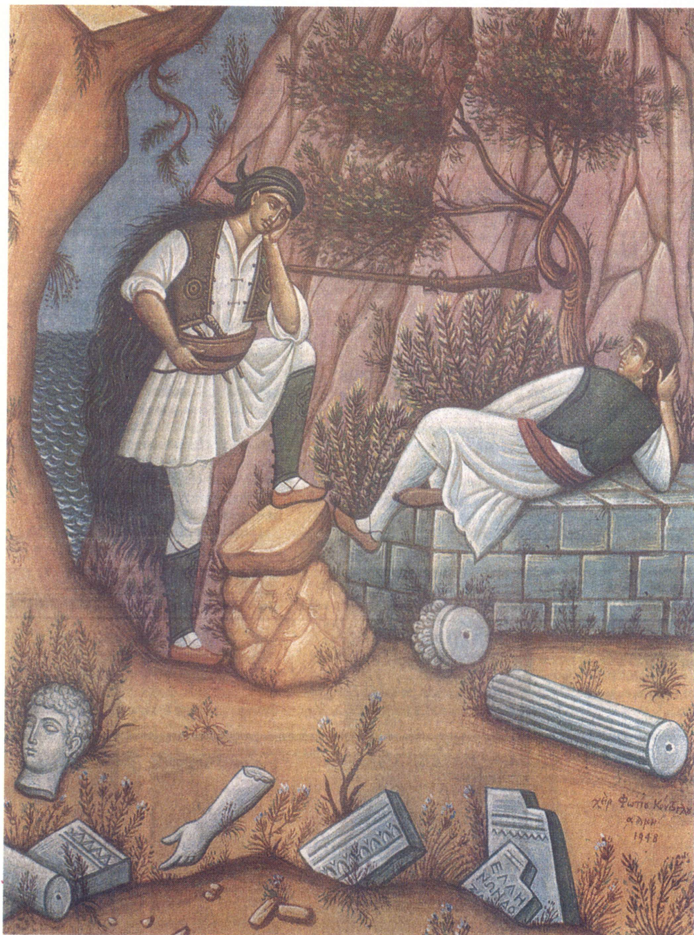
Τοιχογραφία του Φώτη Κόντογλου στο Δημαρχείο της Αθήνας.