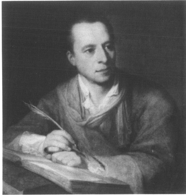
Ἰωάννης Ἰωακείμ Winckelmann (1717-1768)

ἐν τῷ εἶδει αὐτοῦ τὴν ὁδὸν τῆς ἀπ' εὐθείας ἀναζητήσεως τῆς ἀρχῆς καὶ τῶν πηγῶν, ἵνα ἀνεύρωσι καθαρὰν καὶ ἀμιγῆ τὴν ἀλήθειαν. Ἡ πηγὴ αὕτη εἶναι ἡ Φύσις».