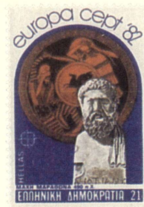
ΜΑΧΗ ΜΑΡΑΘΩΝΑ 490 π.Χ.

Τὸ 1982 ἀπὸ τὰ δύο γραμματόσημα γιὰ τὴν Εὐρωπαϊκὴ Ἑνωσι (EUROPA C.E.P.T.) τὸ ἓνα εἰκονίζει τὸν ἔρμη τοῦ Μιλτιάδου, πὺ βρῖσκεται στὸ Μουσεῖο τῆς Ραβέννας, μὲ φόντο παράσταση συμπλοκῆς Ἀθηναίου ὀπλίτη καὶ Πέρση καὶ ἀποκάτω, μὲ μικρότατα γράμματα, ΜΑΧΗ ΜΑΡΑΘΩΝΑ 490 π.Χ.: