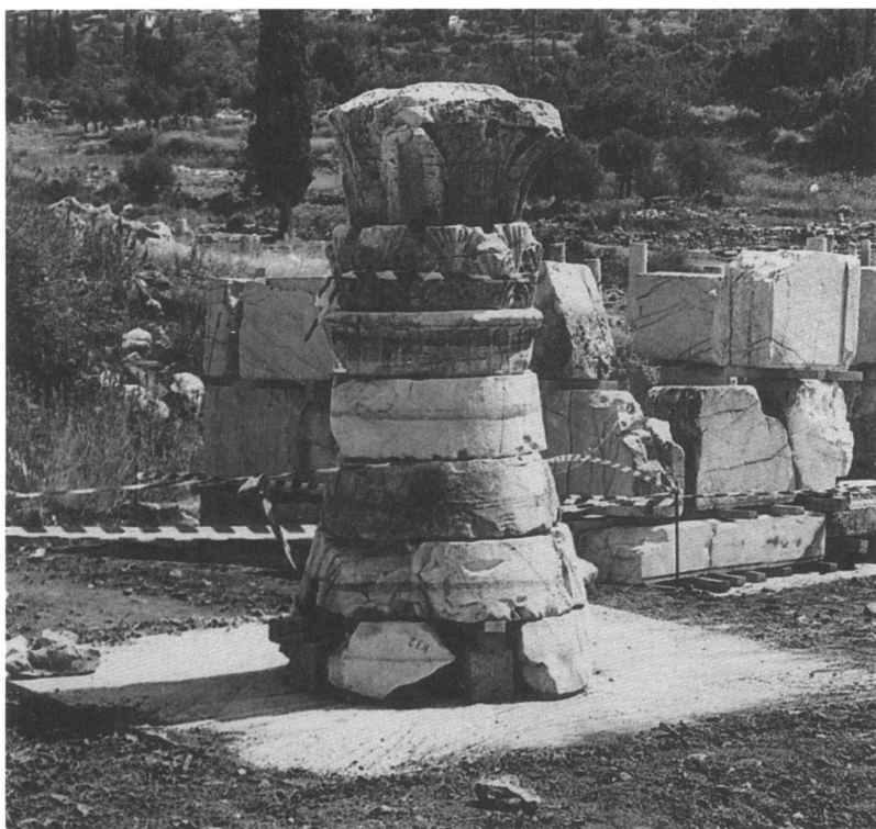
Ἡ ἀπόληξη τῆς στέγης τοῦ μνημείου Κ3.