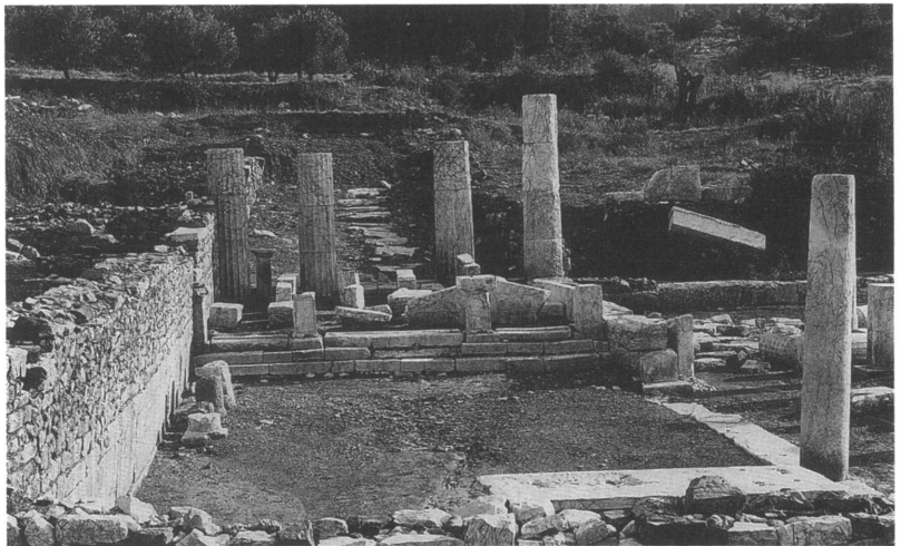
Τὸ πρόπυλο στὴ δυτικὴ στοὰ τοῦ Γυμνασίου.

τωπο τοῦ μεσαίου ἐπιστυλίου χαραγμένη δίστιχη ἐπιγραφή τῶν χρόνων τοῦ Αὐγούστου μᾶς πληροφορεῖ ὅτι τὸ πρόπυλο ἀνέθεσε στους θεοὺς καὶ στὴν πόλη ὁ γυμνασίαρχος Χαρτέλης, γιὸς τοῦ Φίλωνος. Δεύτερη μονόστιχη ἐπιγραφή χαραγμένη κάτω ἀπὸ τὴν προηγούμενη ἀναφέρεται σὲ ἐπισκευὴ τοῦ Γυμνασίου ἀπὸ τὸν γυμνασίαρχο Διονύσιο Δημητρίου. Στὶς τρεῖς κεντρικὲς ἀκόσμητες μετόπες ὑπάρχει τρίτη ἐκτενὴς ἐπιγραφή, πού ἀφορᾷ στὴν προσφορὰ 10.000 δηναρίων στὴν πόλη τῆς Μεσσηνίας ἀπὸ εὐπατρίδη, μάλλον Λάκωνα, γιὰ τίς θυσίες τῶν Σεβαστῶν καὶ γιὰ τὸ λάδι τῶν ἀθλητῶν. Ἡ προσφορὰ ἔγινε τὸ 42 μ.Χ., ὅταν γραμματέας τῶν συνέδρων ἦταν ὁ Μνασίστρατος τοῦ Φιλοξενίδα. Τὸ πρόπυλο ἀναστηλώνεται μὲ βάση μελέτη τοῦ ἀρχιτέκτονος τῆς Διεύθυνσης Ἀναστηλώσεως Ἀθανάσιου Νακάση, καὶ μὲ χρηματοδότηση τοῦ Ἰδρύματος Ἰωάννου Φ. Κωστοπούλου, ὅπως σημειώσαμε ἤδη. Μαρμάρινος κορμός, πού βρέθηκε πεσμένος μπροστὰ σὲ ὑψηλὸ βάθρο στὸ βάθος τῆς αἴθουσας ἀπέναντι ἀπὸ τὸ πρόπυλο, ἀποτελεῖ ἀντίγραφο τοῦ δορυφόρου τοῦ Πολυκλείτου πού ἔρχεται νὰ προστεθεῖ στὰ ὡς σήμερα γνωστὰ παραδείγματα.