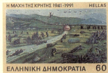
Ἀναμνηστικὴ ἔκδοσις γιὰ τὰ 50 χρόνια ἀπὸ τὴ Μάχη τῆς Κρήτης (1991).