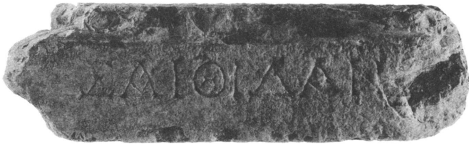
Στέψη βάρου με ἐπιγραφή ἀπὸ τὸ Στάδιο.

Τὴ μελέτη καὶ τὴ δημοσίευση τῶν ἐπιγραφῶν, τόσο τῶν παλαιῶν, δημοσιευμένων στὸν τόμο 5 τῶν IG ἀπὸ τὸν Kolbe, ὅσο καὶ αὐτῶν ποὺ εἶχαν στὸ μεταξύ βρεθεῖ καὶ ἐν μέρει μόνο δημοσιευθεῖ ἀπὸ τὸν Ἀναστάσιο Ὀρλάνδο, ἀνέλαβαν ἤδη ἀπὸ τὸ 1987 οἱ ἐπιγραφικοὶ Ἄγγελος Ματθαίου καὶ Βούλα Μπαρδάνη. Στις 197 ἐπιγραφές, δημοσιευμένες καὶ ἀδημοσίευτες, ποὺ