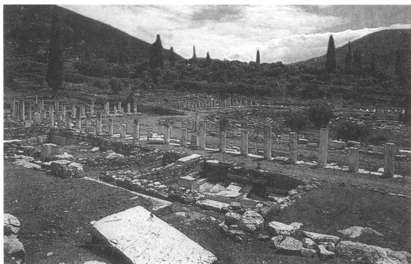
Ἐποψη τοῦ Γυμνασίου ἀπὸ Βορρά.

Τὸ Στάδιο και τὸ Γυμνάσιο ἀνήκουν στὰ πλέον ἐντυπωσιακὰ ἀπὸ ἄποψη διατήρησης οἰκοδομικὰ συγκροτήματα τῆς Μεσσηνίας. Τὸ βόρειο πεταλόσχημο τμήμα τοῦ Σταδίου περιλαμβάνει 18 κερκίδες μὲ 18 σειρὲς λίθινων ἐδωλίων, πού διαχωρίζονται ἀπὸ κλιμακοστάσια. Περιβάλλεται ἀπὸ δωρικὲς στοᾶς, τῶν ὁποίων οἱ κίονες στέκονται κατὰ τὸ πλεῖστον στὴ θέση τους. Ἡ βόρεια στοὰ εἶναι διπλή, ἡ ἀνατολικὴ και ἡ δυτικὴ εἶναι ἀπλές. Οἱ στοᾶς ἀνήκουν στὸ Γυμνάσιο, πού ἀποτελοῦσε ἐνιαῖο ἀρχιτεκτονικὸ σύνολο μὲ τὸ Στάδιο. Ἡ δυτικὴ στοὰ δὲν φαίνεται νὰ συνεχίζεται ὡς τὸ πέρασ τοῦ στίβου· διακόπτεται σὲ ἀπόσταση