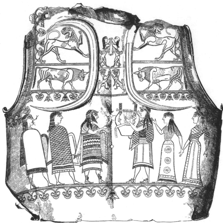
ἽΟπίσθιο μέρος χάλκινου θώρακα, τοῦ Μουσείου Ὀλυμπίας (E. Pfuhl, Malerei und Zeichnung der Griechen III , München 1923, 30)

ἀπεφασίζετε νὰ καταταχθῆ ὁ ἐλληνικὸς οὔτος θώραξ ἐν ὀνόματί Σας εἰς τὴν σειρὰν τῶν λοιπῶν ἐν τῷ Μουσείῳ ἔργων τέχνης. Διότι ἀληθῶς τοιαῦτα μνημεῖα κατατιθέμενα οὕτως ἐν τοῖς Μουσείοις καὶ τὴν μνήμην τῶν πρώτων αὐτῶν κτητόρων διασώζουσιν μαρτυροῦντα περὶ τῶν διασωσάντων αὐτὰ ἀπὸ τῆς ἀφανείας καὶ καταστροφῆς καὶ τὸν λαὸν διδάσκουσι καὶ προάγουσι διὰ τῆς μελέτης αὐτῶν καὶ μιμήσεως εἰς τὸν πολιτισμὸν.