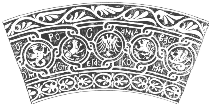
Λεπτομέρεια τοῦ μέσου τμήματος τοῦ ἀνάγλυφου ὑπερθύρου τῆς βασιλείου πύλης ('Α. Ὀρλάνδου, Ἡ Παρηγορήτισσα τῆς Ἄρτης, ἐν Ἀθήναις 1963, σελ. 99, εἰκ. 108).

Τὸ παράδειγμα τὸ διδόμενον ἡμῖν ἐγγύθεν θέλει χρησιμεύσει πρὸς διατήρησιν καὶ τῶν ἐν τῷ καθ' ἡμᾶς κλίματι μνημείων τῆς χριστιανικῆς τέχνης, ὑπὲρ ὧν δέον νὰ ζητῆται ἡ συμβολὴ δοκίμων ἀρχιτεκτόνων καὶ ζωγράφων».