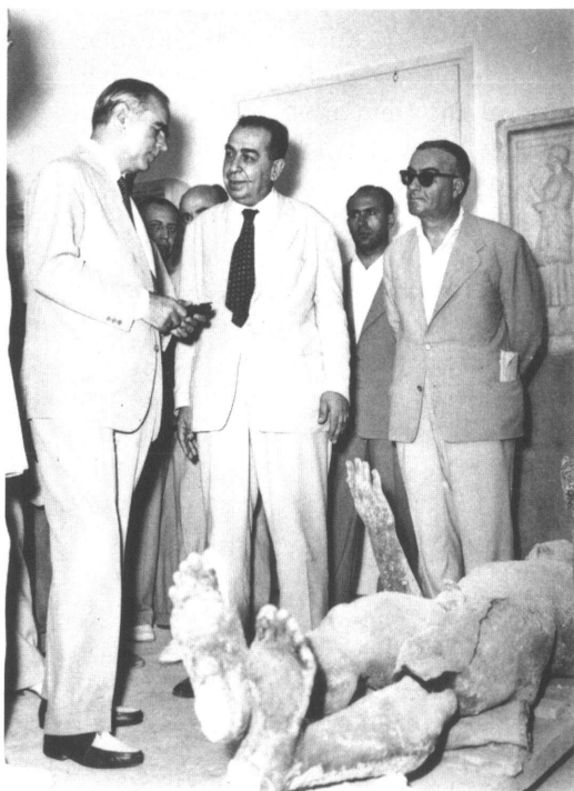
Ὁ νῦν Πρόεδρος τῆς Δημοκρατίας, τότε Πρωθυπουργὸς Κων. Καραμανλῆς καὶ ὁ Ἰω. Κ. Παπαδημητρίου, ἐμπρὸς στὸ χάλκινο ἄγαλμα τοῦ Κούρου τοῦ Πειραιῶς (Αὐγούστος 1959).

Τί ἐγίνε ὡς τὶς 11 Ἀπριλίου τοῦ 1963 τὸ γνωρίζουμε, ἀλίμονο, μόνον οἱ σημερινοὶ παλαιοὶ τοῦ Κλάδου πὸ ζήσαμε τὸ ξαφνικὸ μεσουράνημα τῆς Ὑπηρεσίας, τὸ κύρος πὸ ἀπέκτησε καὶ τὸ ἔργο πὸ ἄρχισε νὰ ἀποδίδει, ἔργο πὸ ὀφειλόταν στὶς πρωτοβουλίες τοῦ Παπαδημητρίου καὶ τὸν