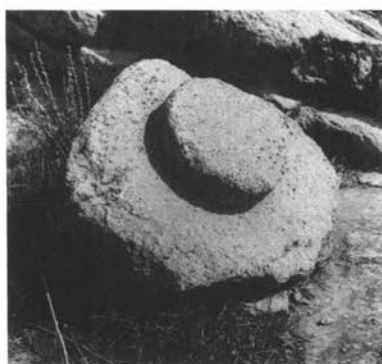
Εικ. 3. Τὸ σκέπασμα τοῦ «Πετρώματος».