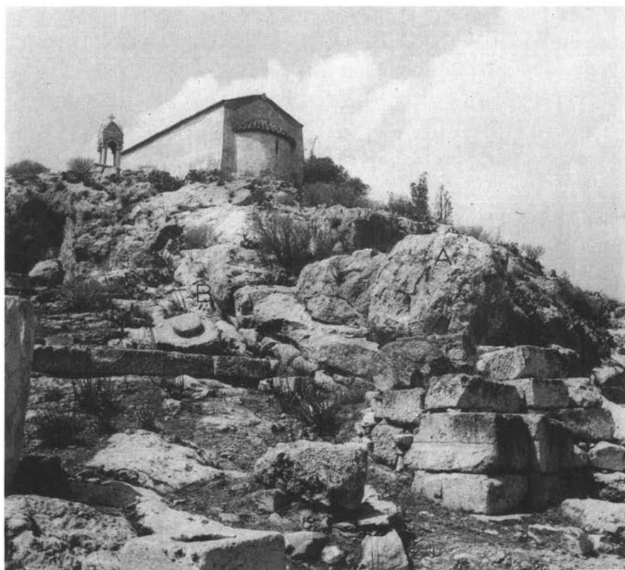
Εικ. 1. Ἡ Ἀγέλαστη Πέτρα μετὸ ἐκκλησιάκι τῆς Παναγίτσας στὴν κορυφὴ τοῦ λόφου. Μὲ γράμματα σημειώνεται ἡ θέση τοῦ «Πετρώματος».