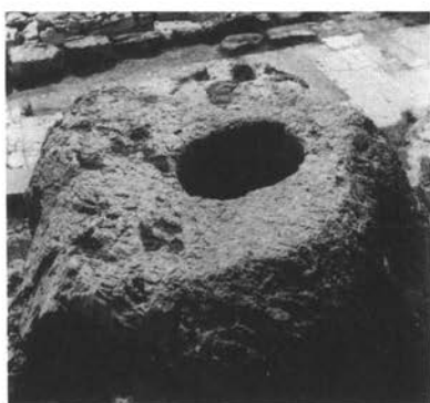
Εικ. 2. Ἀποψὴ τῆς ἄνω ἐπιφάνειας τοῦ «Πετρώματος».