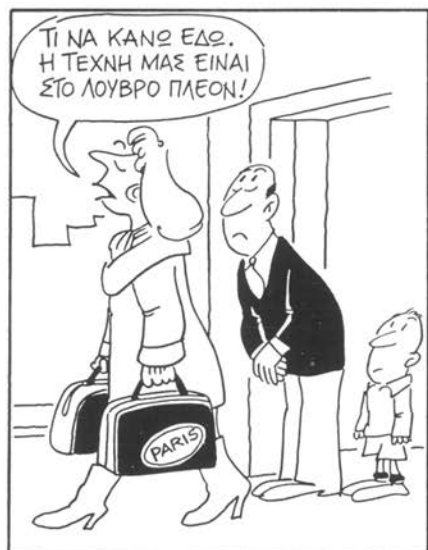
Τοῦ Κ. Μητροπούλου· Ταχυδρόμος 11 (1248), 15 Μαρτίου 1979.