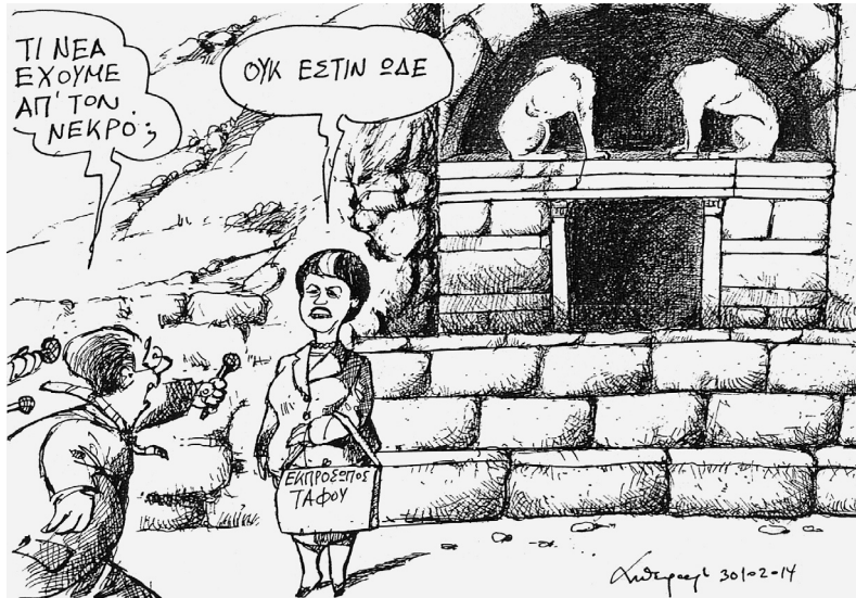
Εικ. 4. Του Άνδρέα Πετρουλάκη (Η Καθημερινή 1 Νοεμ. 2014).

30 Ὀκτ. 2014 (Η Καθημερινή). «Η γ.γ. - - δὲν ἀπέκλεισε τὸ ἐνδεχόμενο νὰ εἶναι ὀριζόντιος σφραγιστικὸς τοῖχος τὸ δάπεδο τοῦ τρίτου θαλάμου» (;). «Ὁ τρίτος θάλαμος - - εἶναι μᾶλλον ὁ τελευταῖος, καθὼς δὲν ὑπάρχει τέταρτο θύρωμα ὅπως ὑπολόγιζε ἀρχικὰ ἡ ὁμάδα. Ἄλλὰ καὶ αὐτὴ [ἡ ὁμάδα] δὲν ἀποκλείει ἕναν ὑπόγειο χῶρο ὅπως ἄλλωστε καὶ ἡ γ.γ.».