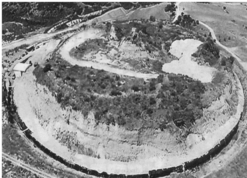
Εικ. 2. Ο λόφος Καστᾶ τῆς Ἀμφίπολης, ὅπως εἶναι σήμερα.

25 Αὐγ. 2014 ( newsit.gr ). «Εἶναι πολὺ πιθανὸ στὸν περίλαμπρο τάφο, λέει σὲ συνέντευξή του στὸ Ἔθνος ὁ Νίκολας Σόντερς, τελικὰ νὰ ἐνταφιάστηκε ἐκεῖ ὁ ναύαρχος τοῦ Μακεδόνα στρατηλάτη Νέαρχος».