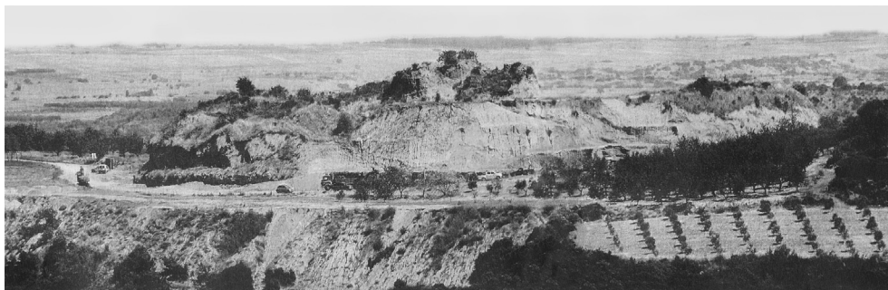
Εικ. 1. Ὁ λόφος Καστᾶ τῆς Ἀμφίπολης, ὅπως εἶναι σήμερα.

ἡ ὁποία ἐξέφρασε ὡς πρὸς τὴ χρονολόγηση τοῦ τάφου τῆς Ἀμφίπολης διάφορη ἄποψη ἀπὸ τὸ ΥΠΠΟ.