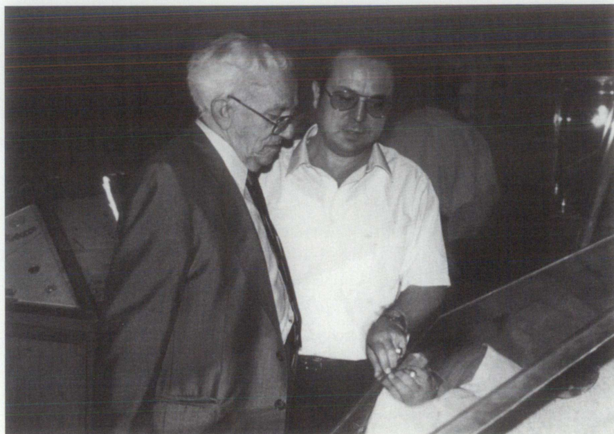
Η τελευταία επίσκεψη του Νικολάου Πλάτωνος στο Μουσείο Ηρακλείου την 10-10-1988.

Η ελληνική και η λατινική γλώσσα και τα γραπτά μνημεία τους ελκύουν το ενδιαφέρον του νεαρού φιλόλογου ευθύς εξ αρχής. Είναι χαρακτηριστικό ότι στα πρώτα 17 χρόνια της σταδιοδρομίας του όλα του τα άρθρα εκτός από το πρώτο (για τη λατρεία των σταλακτιτών στην Κρήτη) είναι σχετικά με την επιγραφική και την ετυμολογία τοπωνυμίων 1 .