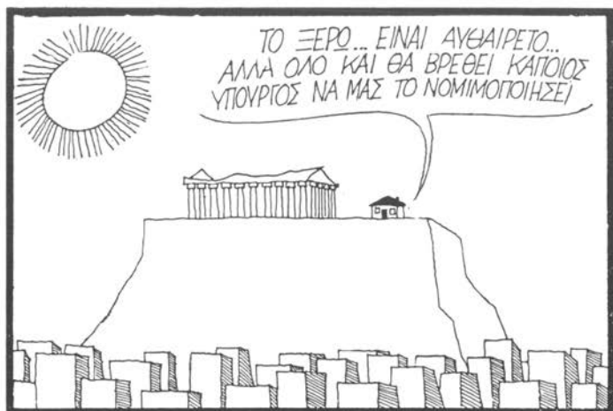
Του ΚΥΡ ( 'Ελευθεροτυπία, Σάββατο 5 Φεβρουαρίου 1983)