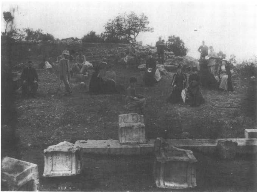
Μέλη και φίλοι του Γερμανικού Αρχαιολογικού Ίνστιτούτου στο θέατρο του Ραμνούντος τὸ 1892

Οἱ ἐπιγραφές τοῦ Ραμνούντος ποὺ ὁ Στάης μετέφερε στὴν Ἀθήνα ἀναμίχθηκαν μὲ τὰ εὐρήματά του τοῦ Σουνίου, καὶ σήμερα ἀκόμη ἀνακαλύπτουμε ἐπιγραφές τοῦ Σουνίου ποὺ ἀνήκουν στὸν Ραμνούντα. Παράδειγμα ἡ στήλη μὲ τὴ γνωστὴ μίσθωση τῆς Ἑρμης (IG II 2 2493), ἡ ὁποία στὴ βιβλιογραφία φέρεται ὅτι προέρχεται ἀπὸ τὴν ἀνασκαφὴ τοῦ ἱεροῦ τοῦ Ποσειδώνα. Στὶς νέες ἐρευνες βρέθηκε στὸν Ραμνούντα τὸ κάτω μέρος τῆς στήλης.