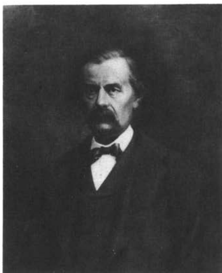
Στέφανος Α. Κουμανούδης (προσωπογραφία ἀπὸ τὸν Ν. Ἀλεκτορίδη στὸ Πανεπιστήμιο Ἀθηνῶν)

Φέτος, στὶς 19 Μαΐου, συμπληρώθηκαν 90 χρόνια ἀπὸ τὸν θάνατο τοῦ Στεφάνου Α. Κουμανούδη, τετάρτου Γραμματέως τῆς Ἑταιρείας, ἀκούραστου πρωτεργάτη της, ἐπὶ 35 χρόνια. Ἀπὸ ἐνωρὶς οἱ ἱστορικοὶ ἀσχολήθηκαν μὲ τὸ ἔργο του καὶ τὰ ἀνέκδοτα γραπτὰ του, τελευταῖα