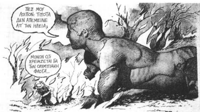
Στάθης, Ριζοσπάστης, Παρασκευὴ 15 Σεπτεμβρίου 1989