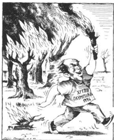
Ἡλ. Μακρῆς, Καθημερινή, Τρίτη 15 Αὐγούστου 1989