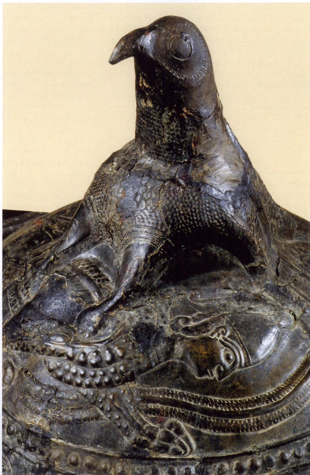
Εικ. 3. Χάλκινη ασπίδα με κεφαλή γενειοφόρου γερακιού.