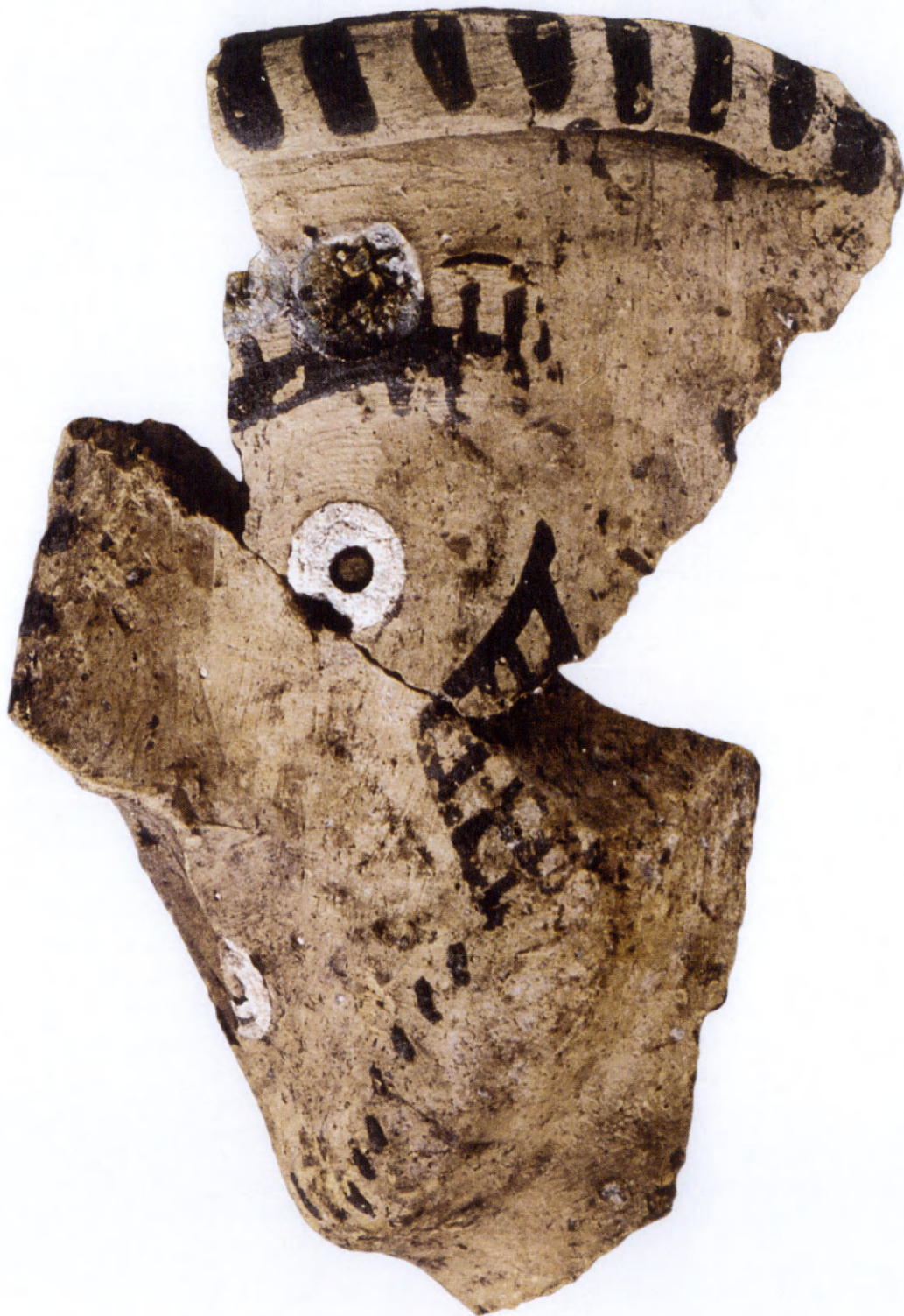
Εικ. 1. Πήλινο ανθρωπόμορφο ρυτό.