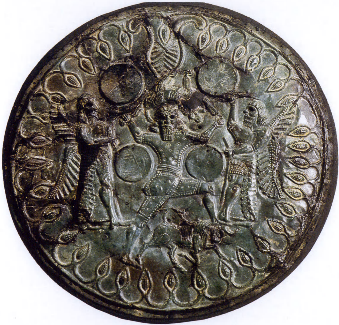
Εικ. 2. Το σφυρήλατο χάλκινο τύμπανο.