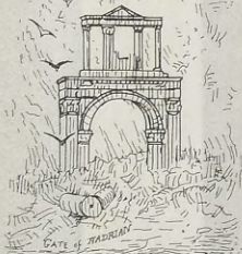
GATE OF STADYRAION