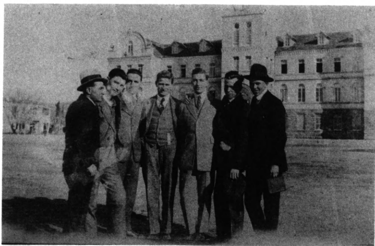
Εικ. 3. Το International College στη Σμύρνη και οι διδάσκαλοί του, 1919.