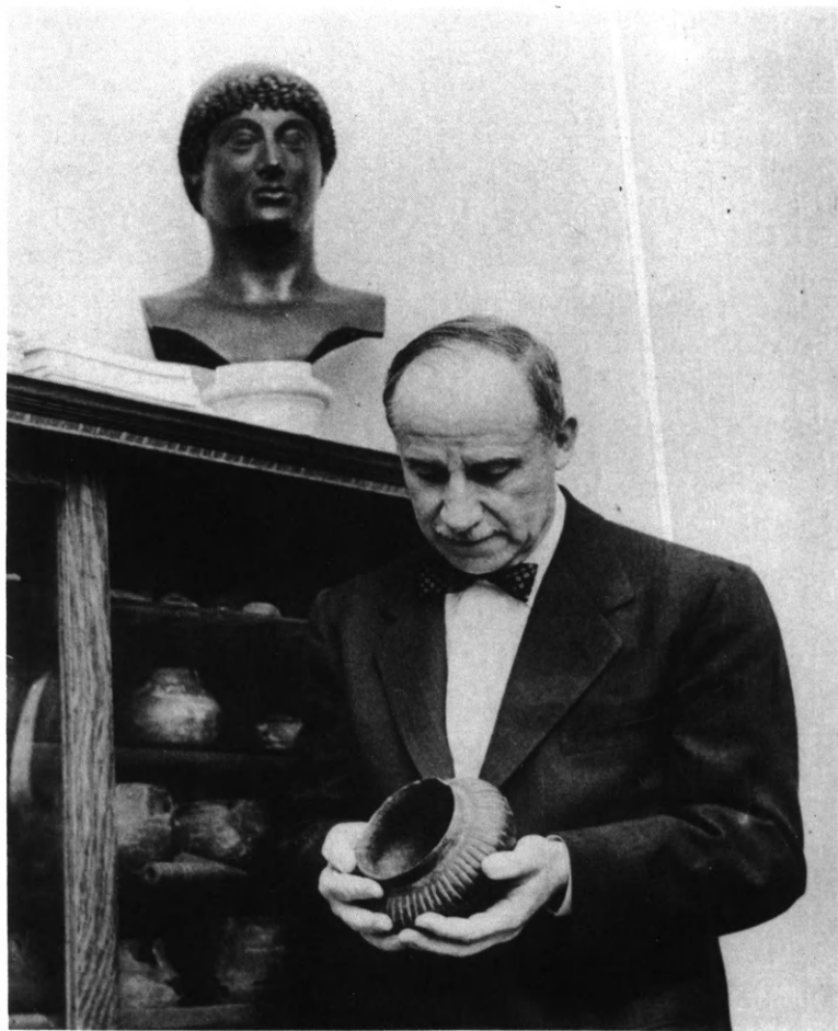
Εικ. 1. 'Ο Γεώργιος 'Εμμανουήλ Μυλωνάς γύρω στο 1956.