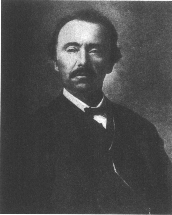
Ὁ Ἡρρίκος Schliemann σὲ ἡλικία 46 ἐτῶν.

Στὴν κτηματικὴ περιουσία τοῦ Calvert περιλαμβανόταν καὶ ἓνα τμῆμα τοῦ λόφου Hisarlik ὅπου ὁ ἴδιος εἶχε ἤδη πραγματοποιήσει μιὰ ἀνασκαφὴ καὶ εἶχε ἀντιληφθεῖ τὴν σημασία του, τὴν ὁποία καὶ ὑπέδειξε στὸν Schliemann ὅταν αὐτὸς ἐπισκέφθηκε τὴν Τρωάδα ἀναζητώντας τὴν ὁμηρικὴ Τροία. Ἀντιλαμβανόμενος ὅτι βρισκόταν πολὺ κοντὰ στὸν στόχο του, ὁ Schliemann ἐπέλεξε τὴ θέση αὐτὴ γιὰ τὶς ἀνασκαφές πού ἐπρόκειτο νὰ τὸν κάνουν διάσημο.